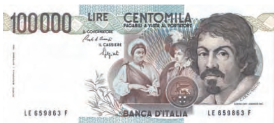
Banconota 1° tipo

Il Caravaggio I Tipo fa parte dei biglietti emessi dalla Banca d'Italia negli anni '80, rivisitati negli anni '90 con un restyling che non cambia i personaggi rappresentati nei tagli maggiori (50.000 e 100.000 lire) ma ne perfeziona le caratteristiche iconografiche esistenti migliorando, nel contempo, grazie all'introduzione di nuovi e più sofisticati sistemi di sicurezza, la lotta alla contraffazione divenuta sempre più difficile da contrastare per la diffusione in campo grafico di sistemi computerizzati, scanner e fotocopiatrici. Il personaggio celebrato in questa banconota è Michelangelo Merisi detto Caravaggio che solo nel 2007, grazie al rinvenimento dell'atto di battesimo del pittore nell'Archivio Diocesano di Milano