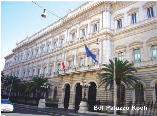
Bdl Palazzo Koch

contrassegnato l'era Fazio, risoltesi dopo fin troppo tempo, causando una gravissima perdita di credibilità internazionale, hanno consigliato al Legislatore di limitare a sette anni la durata in carica del Governatore, periodo questo sufficiente per poter impostare e perseguire le proprie idee in tema di politica economica e finanziaria, sfalsandone l'inizio e la durata in carica con quella teorica del Governo nominante, espressione della Legislatura vigente, che è quella di cinque anni.