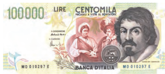
Banconota 2° tipo

Nel retro del biglietto, è riprodotto il